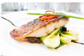
Gebratener oder gegrillter Fisch