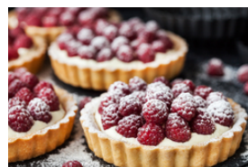
Desserts und Früchte