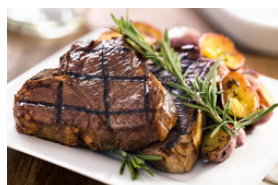
Rindfleisch mit dunklen Saucen, auch gegrillt oder gebraten