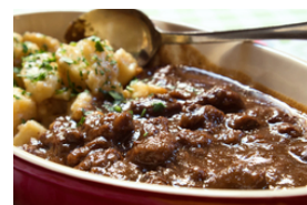
Wildfleisch mit dunklen Saucen, auch gegrillt oder gebraten