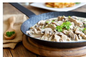
Kalbfleisch mit dunklen Saucen