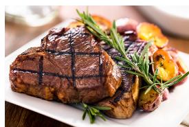
Rindfleisch mit dunklen Saucen, auch gegrillt oder gebraten