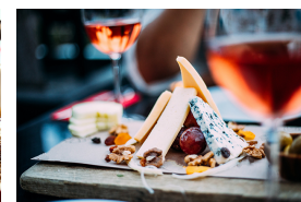
Hartkäse aus Kuhmilch