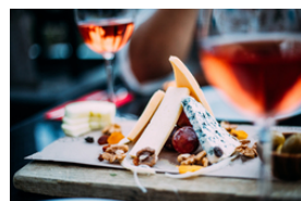
Weichkäse aus Kuhmilch