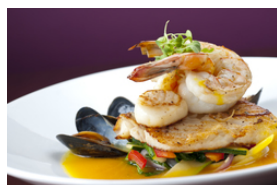
Gebatene und gegrillte Meeresfrüchte, auch mit Saucen