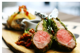
Lammfleisch mit dunklen Saucen