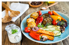
Délicieux avec différents légumes