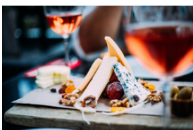
Weichkäse aus Ziegen- oder Schafmilch