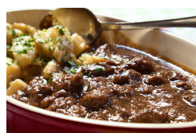
Gibier avec sauce foncée, aussi grillés ou rôtis