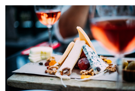
Fromage à pâte dure à base de lait de vache