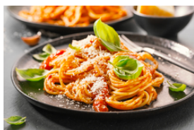
Pâtes avec viande