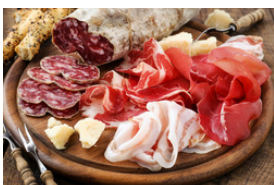
Viande et charcuterie