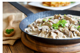
Kalbfleisch mit dunklen Saucen