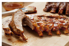
Schwein mit hellen Saucen