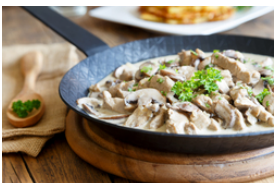
Kalb mit hellen Saucen