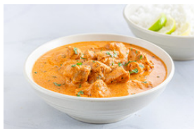
Rindfleisch mit dunklen Saucen Curries